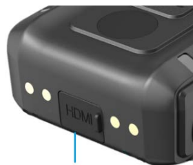
HDMI SD КАРТА